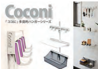
「ココに」多目的ハンガーシリーズ

1000アイテム以上販売する。「フラッシュ棚柱」はシンプルなデザインを追求し、取り付け穴やネジを一切みせない棚柱をつくりたいという理想をカタチにした製品。また「桟レス床下点検口」は外枠取付時にブラ受けを採用し受桟レス化し施工方法を一新した。「ココに」はメーン商品の棚柱に取り付けられる壁面収納ユニットで品揃え豊富なアクセサリパーツを組み合わせて用途に合わせた収納スタイルが選べる。「ココに」は展示会で評価を受け認知度がアップし、販売代理店を増やしている。